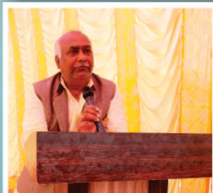
Hon. Shree Ram Shakal (Rajya Shabha, Member of Parliament)